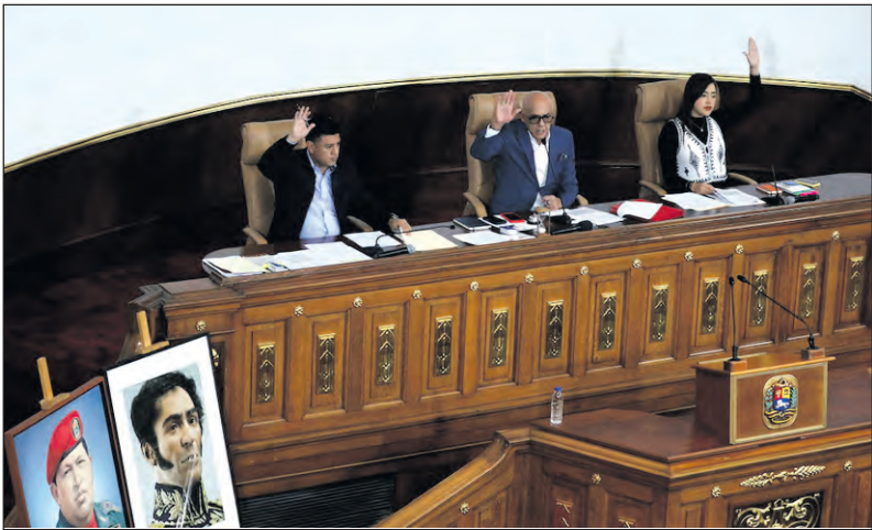
Miembros del Parlamento de Venezuela.

La Asamblea Nacional de Venezuela aprobó por unanimidad en una primera votación un proyecto de Ley de Amnistía que podría beneficiar a cientos de personas encarceladas por su participación en protestas o por expresar críticas a figuras públicas.