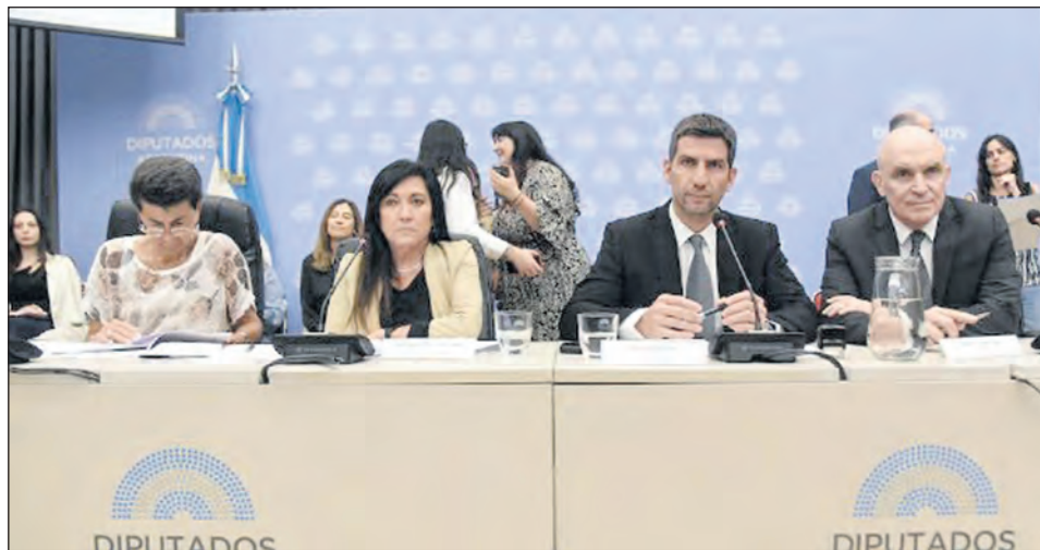
Reunión Conjunta de Comisiones de Justicia, Legislación Penal y Presupuesto y Hacienda.

La idea de los libertarios es replicar el proyecto que durante las sesiones ordinarias del año pasado obtuvo dictamen pero perdió estado parlamentario. Ese texto planteaba originalmente bajar la edad de imputabilidad a 13 años pero el consenso entre los diputados le había puesto un piso de 14 años. “Vamos a ir por los 14 años ese es el consenso al que se llegó el año pasado con los aliados”, agregaron en