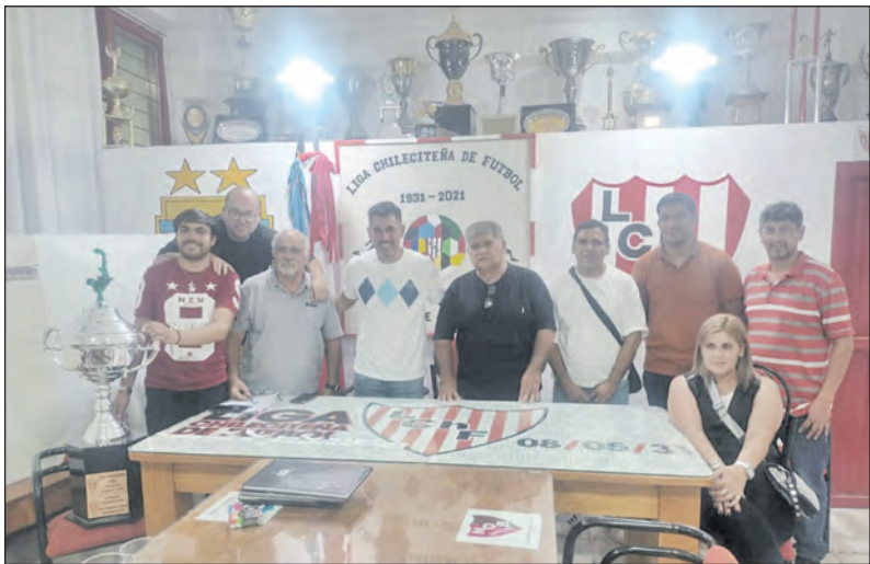
La dirigencia se dio cita en Chilecito, donde dejó definido detalles del Provincial 2026.

En Chilecito, las máximas autoridades del fútbol provincial se dieron cita para oficializar los grupos y el calendario del Torneo Provincial 2026. Con 17 equipos en competencia y el regreso de históricos, el 21 de febrero es la fecha marcada para dar el puntapié inicial.