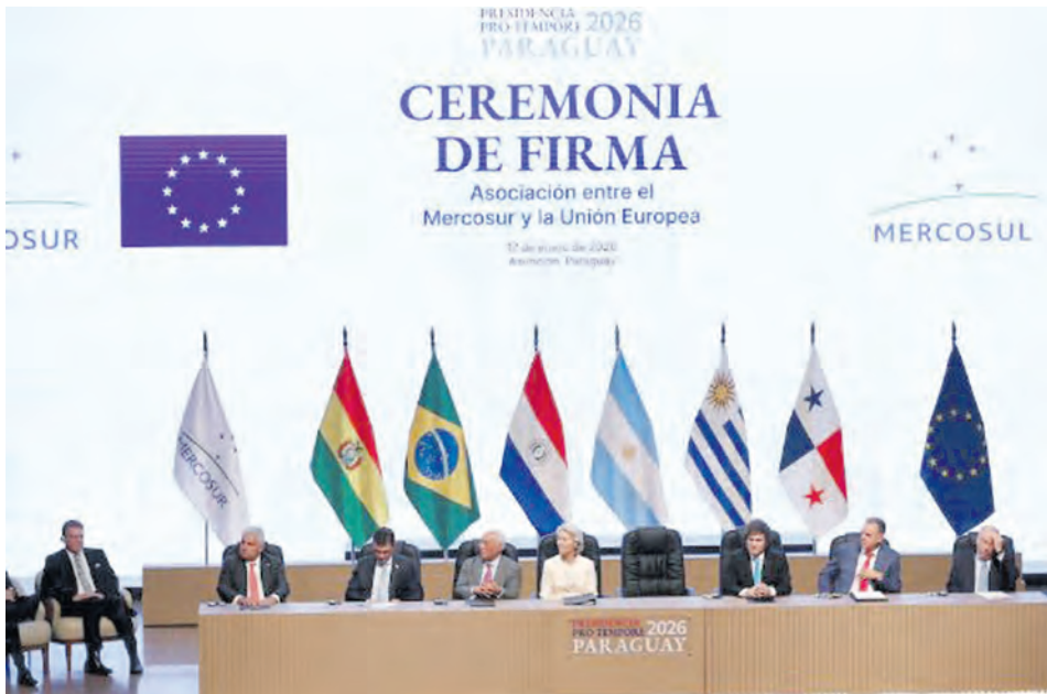
Firma del acuerdo UE Mercosur el 17 de enero pasado en Asunción.

Por su parte, el apuro que mostró el Gobierno desde un principio no es casual, ya que la entrada en vigencia del acuerdo permitiría cubrir cuotas de exportación de algunos productos -carne, por ejemplo- antes que otros de los socios regionales.