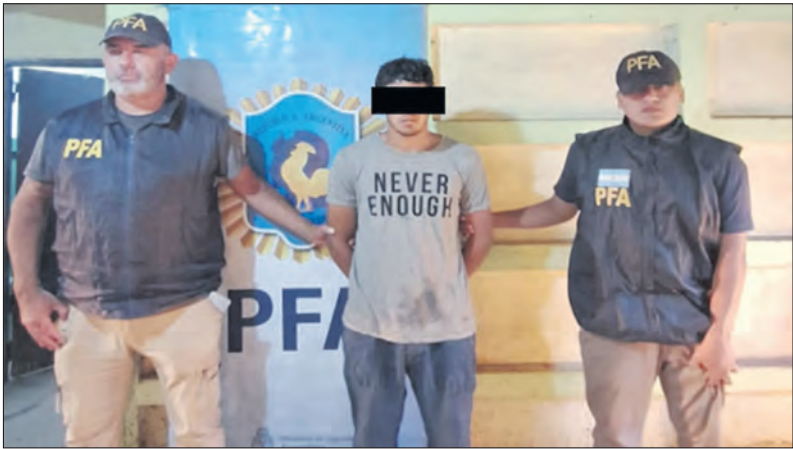
El sospechoso quedó detenido por trata de personas.