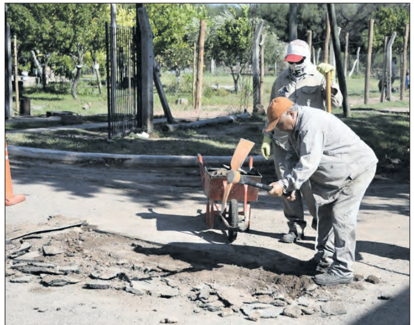
Se realizaron reparaciones para corregir baches y deterioros en la calzada.

De este modo, se busca asegurar un acceso