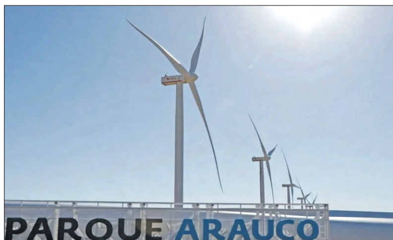
Parque Arauco renovó la certificación de su Sistema de Gestión Ambiental bajo la norma internacional ISO 14001:2015.

El proceso de auditoría confirmó el cumplimiento de los estándares internacionales, destacando el seguimiento de objetivos ambientales y la mejora continua de sus procesos.