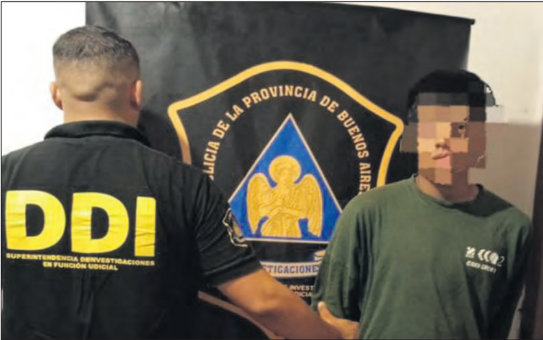
El joven acusado de ser el conductor del vehículo que embistió a la víctima.

Un joven de 19 años fue detenido en las últimas horas en la localidad de Presidente Derqui, en el partido de Pilar, acusado de atropellar y matar a un hombre, y escapar del lugar durante la madrugada de ayer.