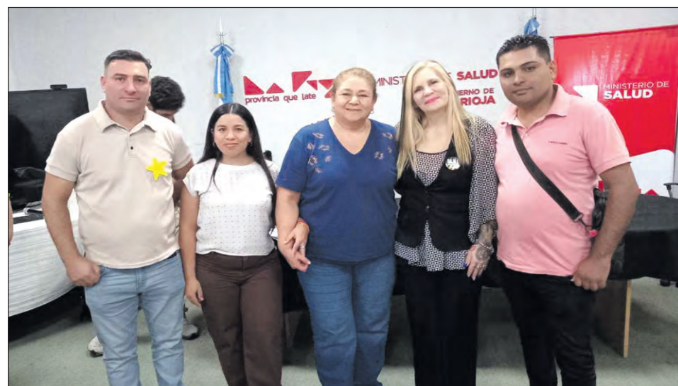
Referentes de seguridad vial participaron del encuentro "Bajá un Cambio".

Desde la organización destacaron que la jornada resultó altamente positiva, ya que permitió reforzar el trabajo articulado entre los distintos niveles del Estado, además de facilitar el acceso a herramientas y acompañamiento para continuar avanzando en políticas públicas de seguridad vial en cada departamento.