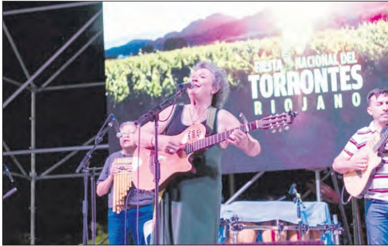
El Festival Nacional del Torrontés Riojano en su edición pasada del 2022.

El festival combinará música, danza y tradiciones con la gastronomía regional y la clásica degustación de vinos torrontés, emblema de la identidad vitivinícola riojana. En esta edición, además, se incorporará por primera vez la degustación de cerveza artesanal, sumando una nueva propuesta para el público asistente.