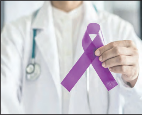
Calas destacó la importancia de la prevención, basada en la detección temprana de lesiones que pueden dar origen al cáncer.

cáncer a nivel mundial. Si bien la cifra de casos de cáncer en Argentina no son precisas, los números son “alarmantes”, como manifestó Calas. Si bien muchos de los tipos de cáncer se pueden prevenir, Calas reveló que la tendencia parece estar en aumento, y más específicamente, los casos de cáncer de pulmón. La clave en cuánto prevención es que llevar un estilo de vida saludable, reconoció el doctor, “tiene que ver con acciones que hacemos todos los días”. “No consumir alcohol, mantener un peso corporal saludable, alimentación saludable a base de frutas y verduras, realizar actividades regulares, vacunarse con las vacunas correspondientes eso es importante también”, argumentó Calas, con respecto a los cuidados que hay que tener en cuenta. De entre los consejos, destacó con mayor relevancia evitar la exposición a la radiación ultravioleta, y explicó que en Argentina nos “gusta mucho el sol, nos gusta mucho estar expuesto al sol, estar bronceado”; sin embargo, consideró que son factores que se pueden pre-