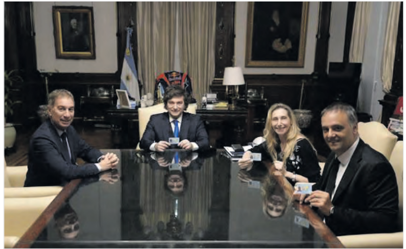
Diego Santilli, Karina Milei y el jefe de Gabinete, Manuel Adorni, también recibieron sus DNI electrónicos junto al Presidente.

El presidente Javier Milei, acompañado de su hermana, la secretaria general de la Presidencia, Karina Milei, el ministro del Interior, Diego Santilli, y el jefe de Gabinete, Manuel Adorni, recibieron los primeros ejemplares de los nuevos DNI electrónicos.