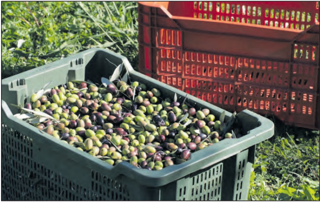
Desde UATRE remarcaron que, en estas condiciones, pelagra el inicio de la cosecha de aceitunas por falta de acuerdo.

La UATRE reafirmó su compromiso con el diálogo respon-