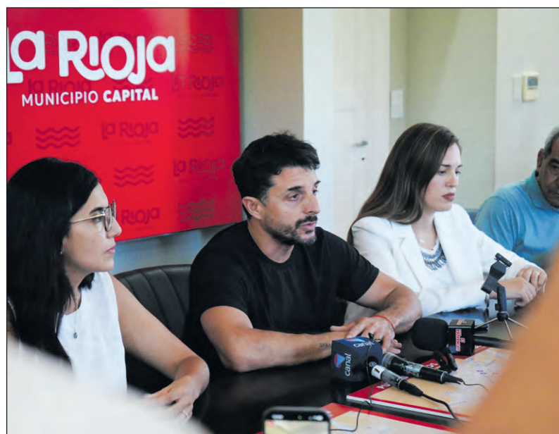
Autoridades municipales brindaron detalles del “histórico plan” de semaforización que se realizará en la Capital.