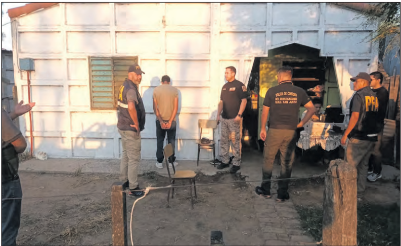
El sospechoso detenido.