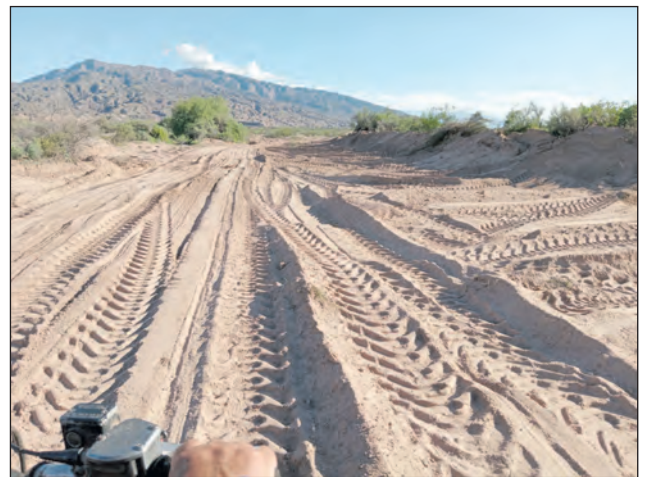
Reconstrucción de defensas en el río Los Sauces, localidad de Alpasinche.

Continúan expresando que “en la localidad de Alpasinche con las primeras lluvias del mes de diciembre de 2025 quedó en descubierto la necesidad de desmonte y reconstrucción de las defensas en campo abierto dado que las crecientes colocaron en riesgo de inundación a dos barrios donde viven alrededor de cincuenta familias, donde además se encontraban la Escuela primaria N° 118 El Retiro”, el Jardín de Infantes, el Centro de Atención Primaria de Salud, las instalaciones del club San Nicolás, la Biblioteca Pública, la Usina de EDELaR y diversas fincas con cultivos, frutales y hortalizas, destacándose que los trabajos realizados fueron de grandes dimensiones en los distintos fren-