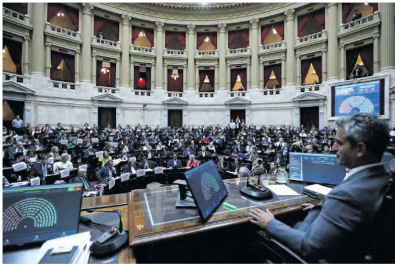
Será el jueves, un día después de que el Senado trate la Reforma Laboral.

Por otro lado, también había reducido de 20 a 15 años de prisión efectiva la pena máxima para delitos graves como homicidio, abuso sexual o secuestro. Eso posibili-