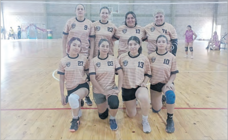
Equipos femeninos y masculinos vivieron el intenso torneo relámpago.

Cada equipo reconoció a sus jugadores destacados, en un gesto que resaltó el esfuerzo, la entrega y la pasión demostrada en cada set.