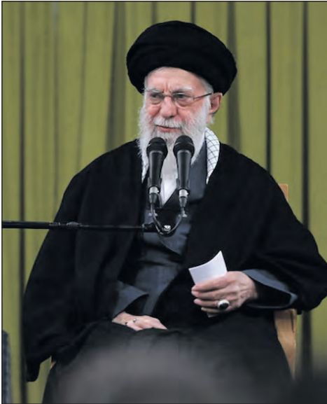
El líder supremo de Irán, Ali Khamenei.