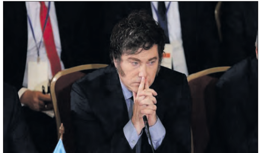
El mandatario asistirá a la cumbre del bloque regional que tendrá lugar en Foz de Iguazú, Brasil.

libertario asistirá con un discurso en el que insistirá con la necesidad de que el bloque se abra al libre comercio y elimine la reglamentación que limitan los entendimientos con el resto de los países.