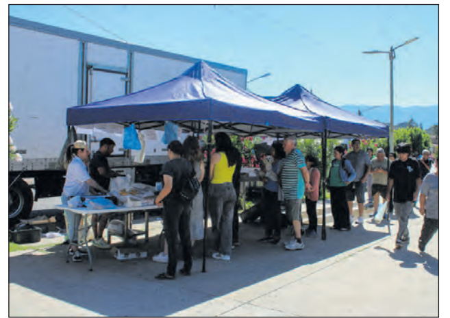
El camión de venta ofreció pescado fresco en Chilecito.

Con el objetivo de garantizar el acceso a alimentos frescos, nutritivos y a precios accesibles, el programa "Pescados para Todos" recorrió distintas localidades del interior provincial y registró una respuesta masiva por parte de la comunidad.