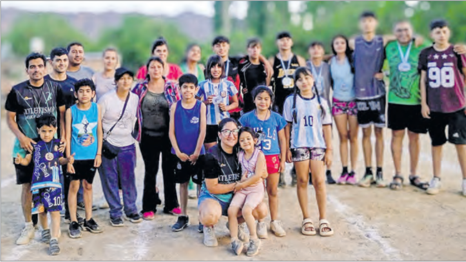
Una gran participación, a la que se sumaron los más pequeños. En la gráfica junto a los organizadores.