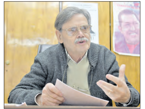
“Queremos que el ciudadano se exprese no solo dar la vuelta a la plaza”, afirmó De Leonardi.

Alicia argumentó que “es una reforma que tiene tres patas: Una transfiere dinero del trabajo al capital directamente, por otro lado también se financia el ANSeS de una manera atroz y por último, se está tratando de disci-