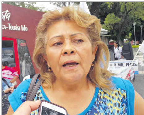
“Un proyecto de ley que pone vulnerabilidad a los trabajadores informales”, declaró Martínez.

Por su parte dirigentes del PC de La Rioja acompañarán a las centrales sindicales que marchan desde las 9:30 en plaza 25 de Mayo, en contra de la Reforma Laboral que pretende sancionar el Congreso de la Nación.