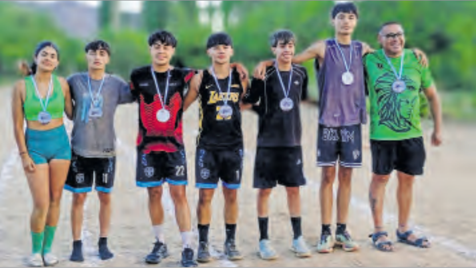
El podio con los premiados de la prueba de Salto en Largo que tuvo buen nivel.