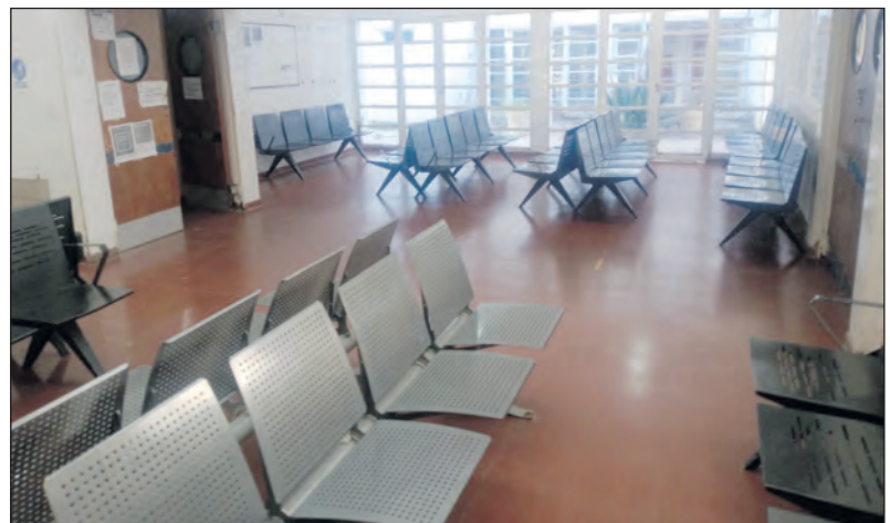
Un sector del hospital “Dr. Vera Barros” se puede observar la ausencia de pacientes y profesionales.

sa de la salud pública y con condiciones dignas para quienes diariamente sostienen el sistema sanitario. También en contra