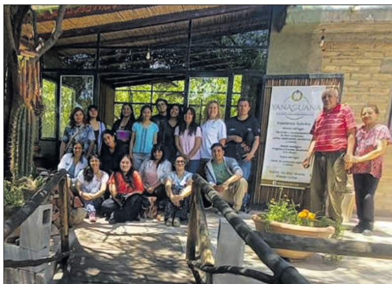
Disertantes y participantes al finalizar el taller.

Para más información, los interesados pueden acercarse a la Oficina de la Secretaría de Producción.