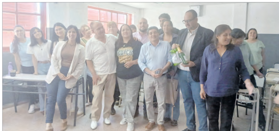
Cuerpo directivo y docente junto a representantes de la Sede de Supervisión de Zona I.