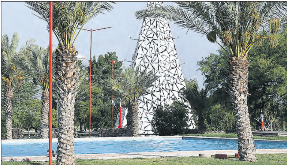
Una de las piletas existente en el Parque de la Ciudad por ahora está inhabilitada.

Las altas temperaturas se hacen sentir en la Capital lo que obliga a muchos a buscar algún remanso como para atenuar el calor. Las piletas de natación son una de las opciones. Por ahora, la propuesta oficial es nula, pues las grandes piletas ubicadas en el Parque Acuático y en el Parque de la Ciudad no están habilitadas.