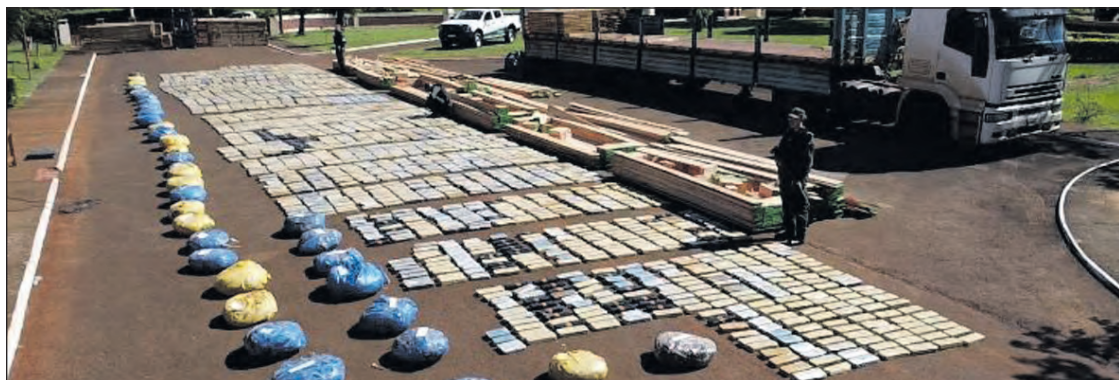
Dos hombres, quienes viajaban hacia Buenos Aires, quedaron detenidos.

Es el tercer secuestro de grandes cantidades de cannabis sativa, los cuales fueron detectados en las provincias de Misiones y Corrientes bajo la misma modalidad. Los funcionaron al inspeccionar el semirremolque de un camión, mediante el uso del escáner de la Fuerza y con la marcación positiva del can "León", descubrieron la existencia de cajones de madera aserrada donde se acondicionaban 2.836 paquetes rectangulares y amorfos con la droga.