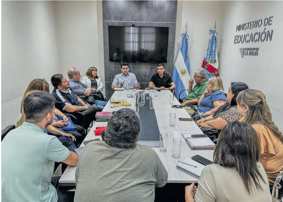
Autoridades del Ministerio de Educación y el Jefe de Gabinete informaron sobre la continuidad del pago del IPE a la docencia riojana.