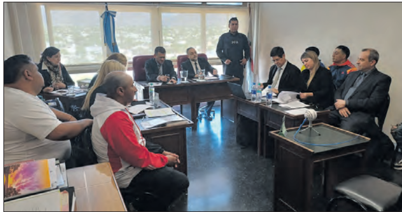
La Justicia Federal condenó a cinco hombres por venta de estupefacientes en el B° 4 de Junio.