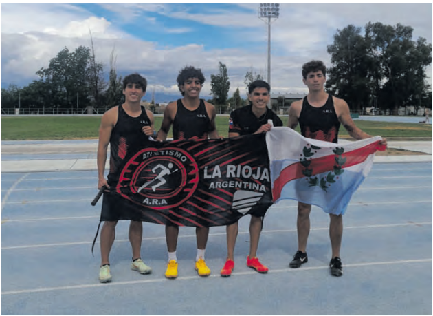
El equipo de Posta 4 x 100 logró una gran marca manual para quedarse con el primer puesto.