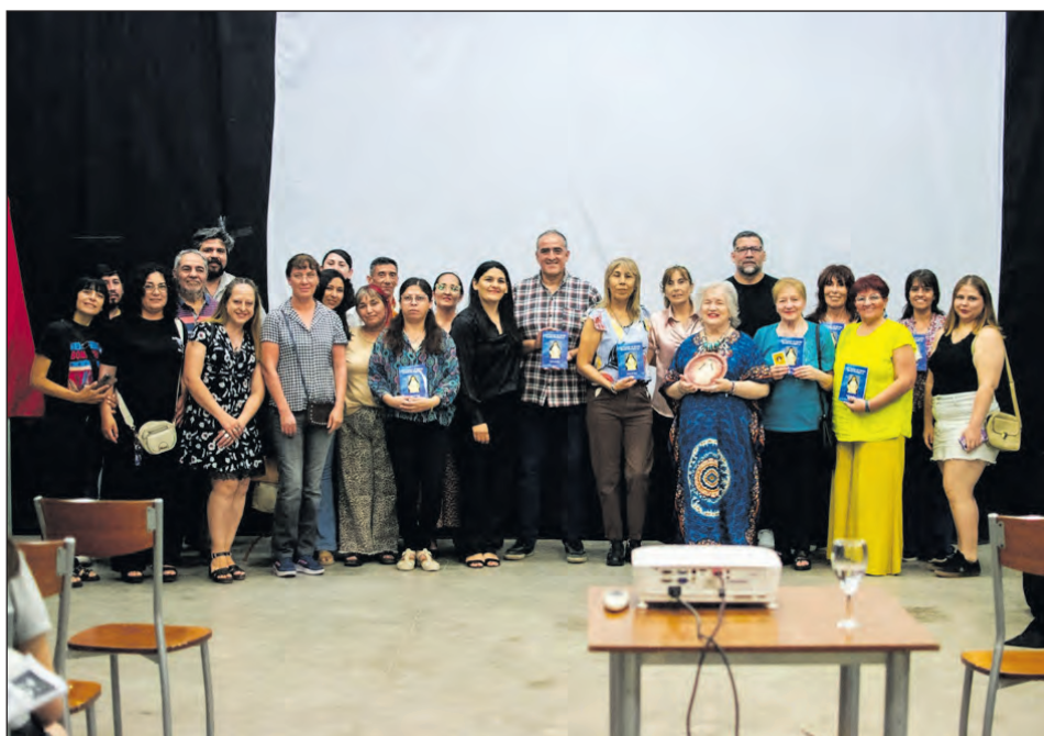
Organizadores, disertantes y participantes al finalizar la jornada.