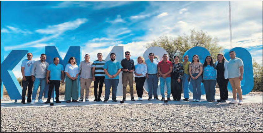
Autoridades presentes en la inauguración del Hito Km 4000 sobre Ruta Nacional N° 40 en Alpasinche.

SAN BLAS DE LOS SAUCES (C). En horas de la mañana del pasado viernes 5 del corriente mes, el Gobierno de la Provincia junto al Municipio de San Blas de los Sauces dejaron oficialmente inaugurado el Hito Kilómetro 4000 sobre Ruta Nacional N° 40, en la localidad de Alpasinche.