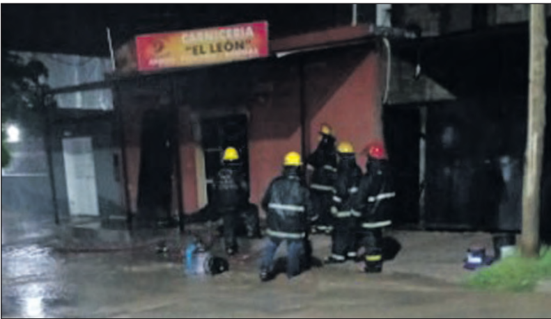
Se incendió una carnicería sobre Av. Malvinas Argentinas, causando graves daños materiales.

Policía logró abrir el acceso para facilitar el trabajo de los equipos de emergencia. Dentro del comercio se encontraban varias garrafas —alrededor de diez—, una de las cuales explotó durante el procedimiento. Afortunadamente, no se registraron heridos. Bomberos de la Policía trabajaron intensamente para controlar el fuego y realizar las tareas de enfriamiento. Asimismo, personal de la empresa de energía eléctrica