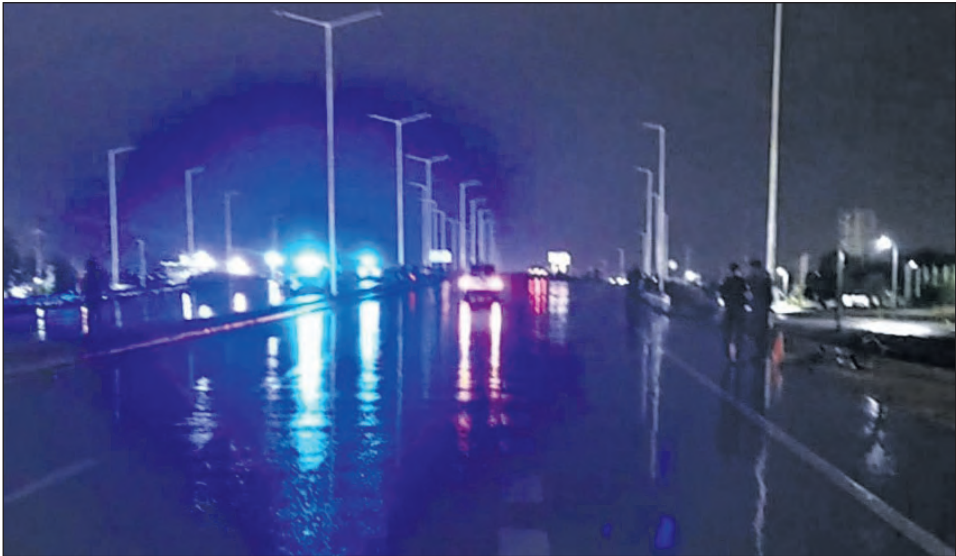
A metros del inicio del puente de la rotonda de El Chacho, un hombre en bici fue atropellado por una camioneta.