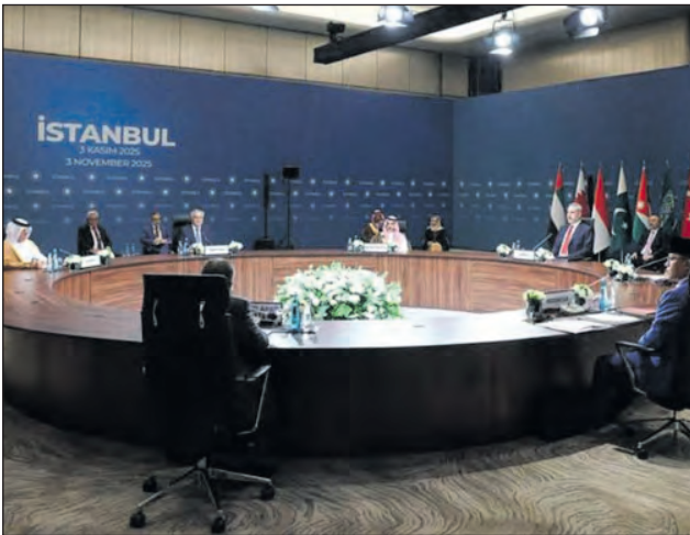
En el Foro de Doha se reclamó un avance rápido hacia un acuerdo de paz permanente.

La condición, según el alto funcionario, es que no se avance rápidamente hacia un acuerdo de paz que sea permanente. Durante su participación en el prestigioso Foro de Doha, el primer ministro qatari enfatizó que para lograr una tregua verdaderamente duradera se necesita el retiro total de las fuerzas israelíes del territorio de Gaza, además del restablecimiento de la estabilidad y de la libertad de movimiento para el pueblo palestino. Esta alerta subraya la enorme fragilidad del acuerdo de cese de hostilidades que había entrado en vigor el pasado 10 de octubre, producto de negociaciones entre Egipto, Qatar, Turquía y