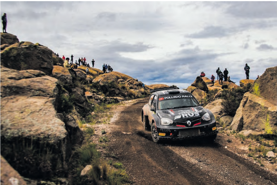
El piloto riojano tuvo un gran cierre de temporada y acarició el triunfo en Mina Clavero.

Sin embargo, más luego llegaron decisiones de mayor peso que fue, puntualmente, la cancelación de una de las tres pruebas especiales que se debían llevar a cabo en la