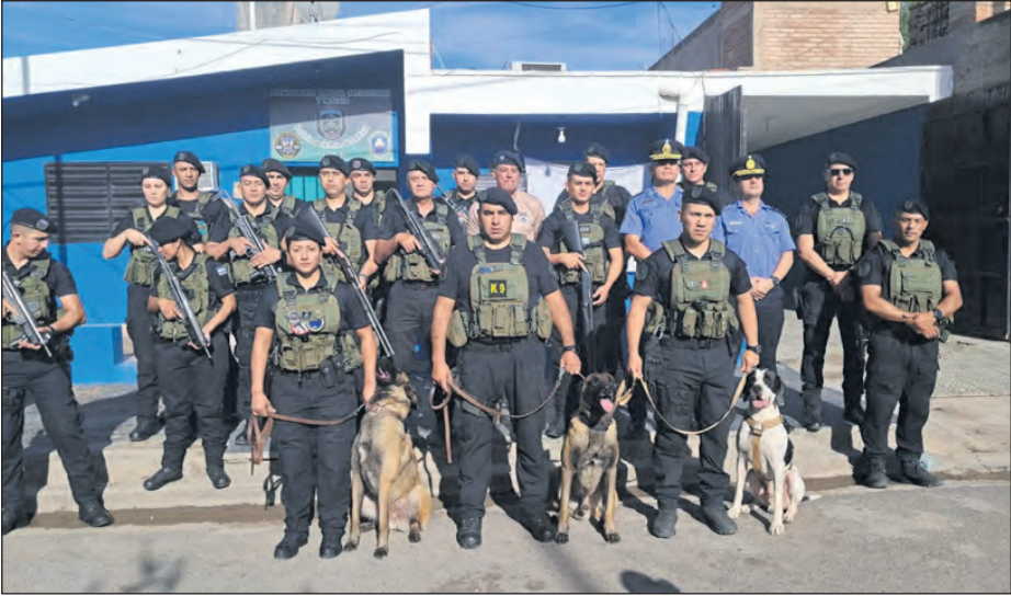
Participaron autoridades policiales y referentes institucionales.

En Chilecito se llevó a cabo el acto por el 30° aniversario del Departamento Especial de Anti-disturbios y Rescate (DEAR), que incluyó el izamiento de banderas y la entrega de certificados a personal destacado por su compromiso con la seguridad pública. En la ciudad de Chilecito se realizó el Acto Protocolar por los 30 años de vida Institucional del Departamento Especial de Anti-disturbios y Rescate (DEAR). Durante la ceremonia se realizó el tradicional izamiento de banderas y la entrega de Certificados de Reconocimiento a personal destacado por su incansable labor, compromiso y dedicación diaria en favor de la seguridad de toda la comunidad.