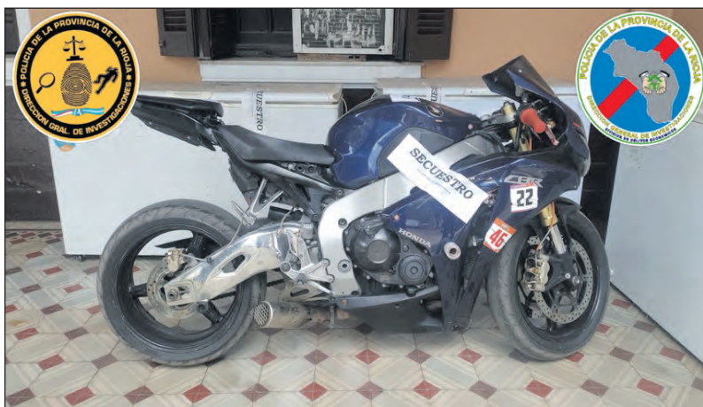
Por orden judicial, la Policía secuestró una motocicleta Honda 1000 cc.

La División de Delitos Económicos de la Dirección General de Investigaciones cumplió este viernes por la tarde con una orden judicial que disponía el secuestro de una motocicleta Honda CBR 1000 cc. en el marco de una causa por presunta defraudación.