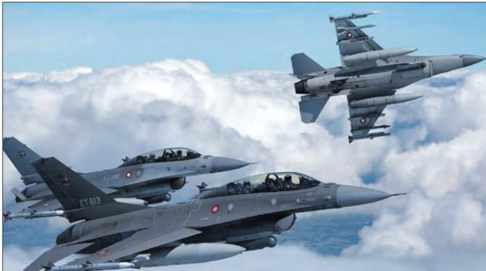
Los aviones supersónicos F-16 que compró Argentina a Dinamarca llegaron a Córdoba.

El presidente Javier Milei recibirá hoy a los aviones F-16 que el Gobierno compró a Dinamarca y encabezará el acto central y el primer vuelo de exhibición. Las actividades estaban previstas para mañana, pero por cuestiones climáticas las autoridades decidieron adelantar el cronograma, según confirmaron fuentes oficiales.