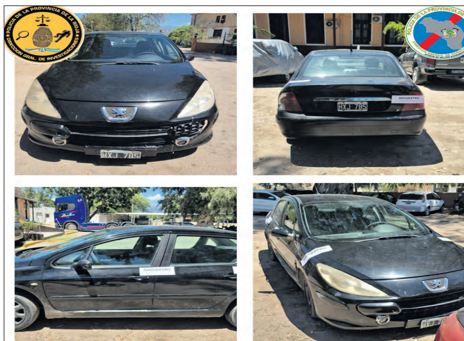
Imágenes del automóvil que fue incautado por las autoridades en una causa judicial.