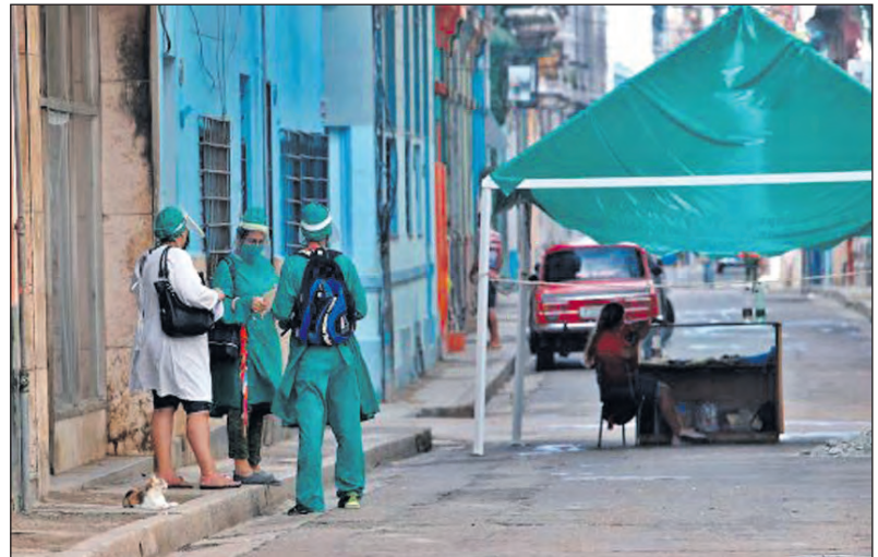
Cuba registró más de 1.000 nuevos casos de dengue y chikunguña en un solo día.

Por su parte, la investigadora del Instituto de Medicina Tropical Pedro Kourí, María Eugenia Toledo, recordó que los brotes de chikunguña suelen ser "muy