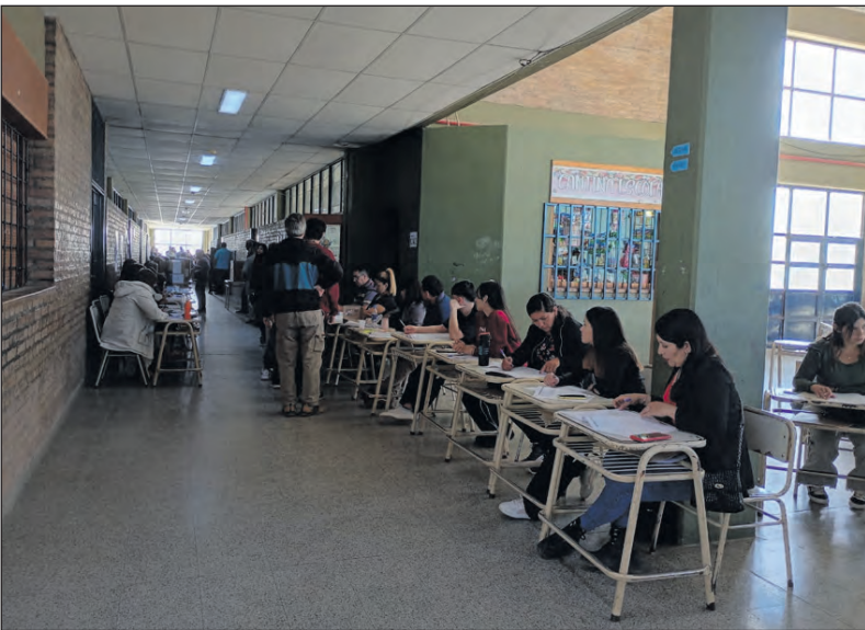
Anunciaron que el 10 de diciembre comenzará el pago a las autoridades de mesa que trabajaron en las últimas elecciones.