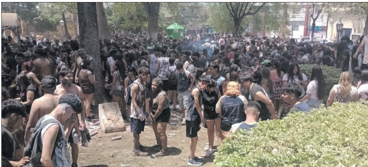
Uno de los grupos de egresados que ayer se despidieron con todo en la plaza 9 de Julio.

Con ese espíritu los adolescentes y jóvenes dieron rienda suelta a todo cuanto podían hacer ante la mirada de padres y peatones que acerta-