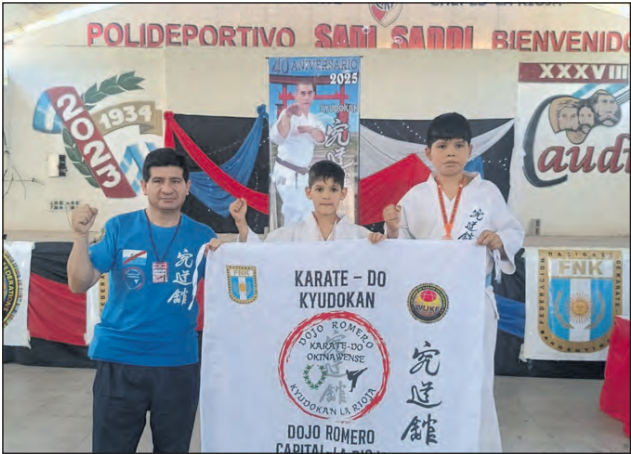
Tres momentos de podios para los karatecas capitalinos.