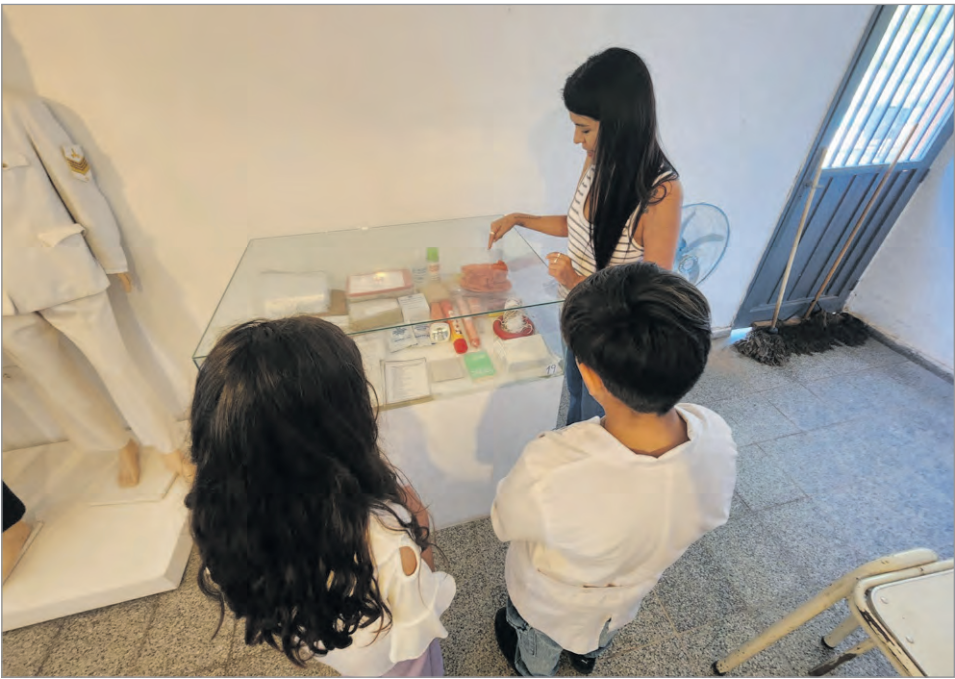
Los alumnos de la escuela de El Tala en el recorrido por el museo.

El Gobierno municipal del departamento Rosario Vera Peñaloza, recibió a los alumnos de la Escuela N° 97, quienes llegaron a la instancia nacional de Feria de Ciencias, recibiendo una mención destacada, por su trabajo denominado "Alimentos que iluminan". Los estudiantes fueron recibidos por la Secretaría de Gobierno, y la Coordinación de