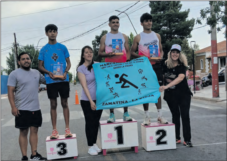
Los podios de Damas –izq– y varones –der– tras la consagración de los mejores en la histórica prueba.