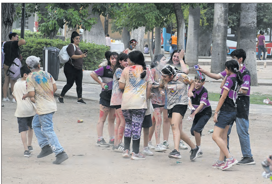
Los alumnos dieron rienda suelta a la alegría y nadie escapó a los festejos del último día.

ban pasar por el lugar. En un sector ubicado por la avenida Rivadavia, frente mismo de la glorieta se formó un barrial que fue aprovechado por todos los alumnos, sin excepción para engrudarse con ese barro que los dejó desconocidos de pie a cabeza.