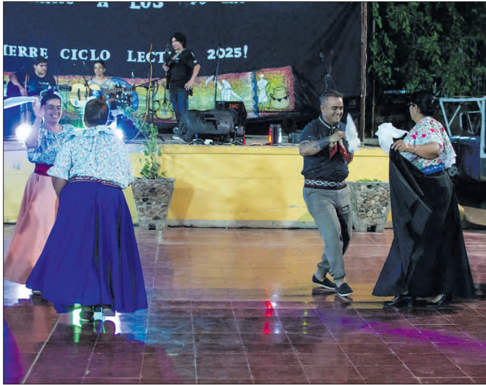
De esta primera jornada, participaron talleres de las Sedes Central, Jamín Ocampo y Castro y Bazán.

Días atrás se llevó a cabo la Primera Jornada de “La Expo de La Osmán” de las Sedes Central, Jamín Ocampo y Castro y Bazán de la Escuela Municipal de Arte “Pintor Osmán Páez”. La misma se desarrolló en la Escuela “Rodolfo Carmona” de la ciudad de Chilecito.