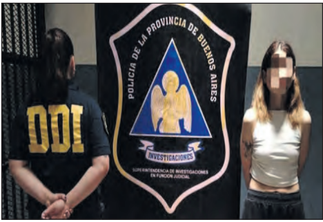
La mujer fue detenida en Lanús por efectivos de la DDI Quilmes.