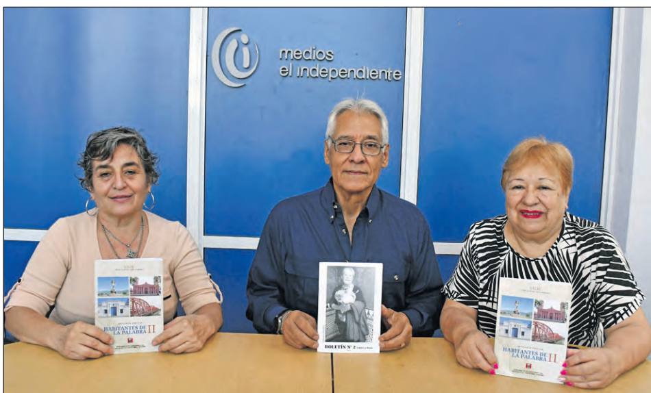
La Sociedad Argentina de Escritores cuenta con más de 85 filiales en todo el país.

Con una participación de más de 70 antólogos