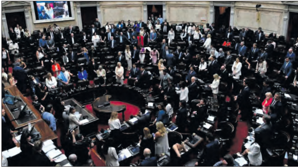
Los 127 legisladores que asumirán en su cargo a partir del 10 de diciembre realizaron al acto protocolar.