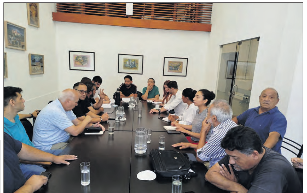
Remiseros y taxistas en la reunión con la comisión de Servicios Públicos.

Desde el recinto deliberativo "Mercado Luna", la primera reunión se realizó con taxistas y remiseros, donde se acordó una actualización en la tarifa que va del 14 al 15 por ciento. En el caso de aprobarse el aumento en