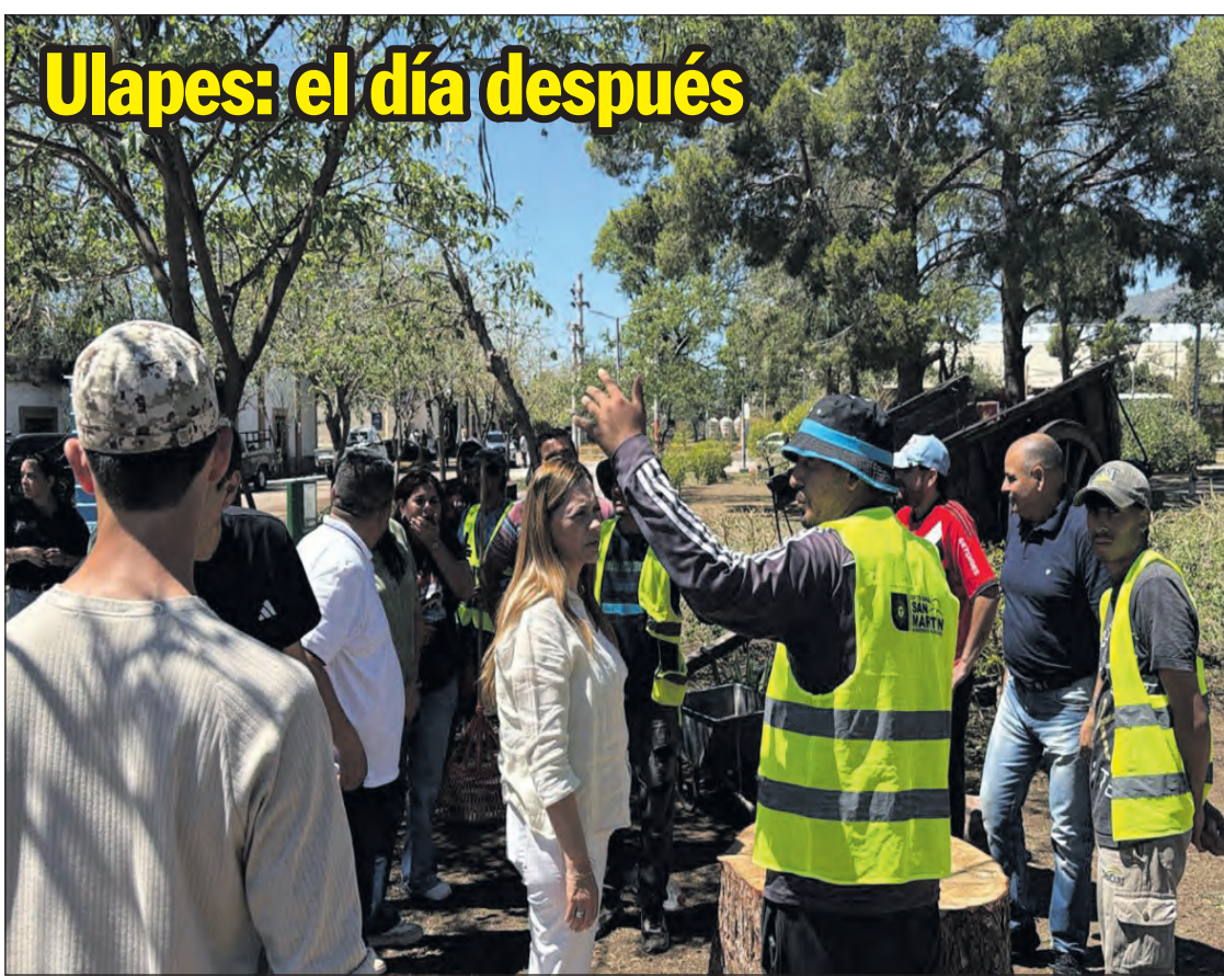
Ulapes: el día después