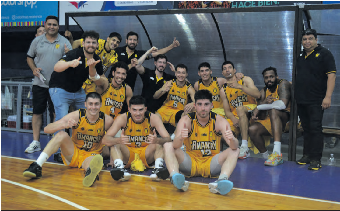
El festejo del plantel “Canario”, cuerpo técnico y dirigentes, tras otro gran triunfo en Chaco.