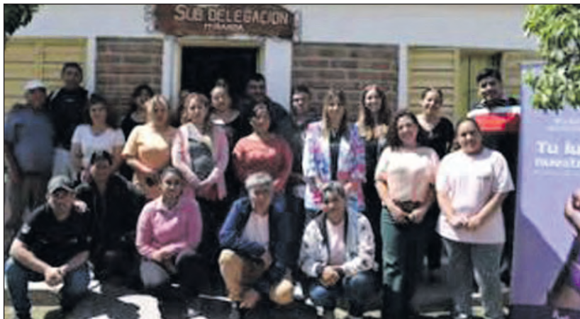
El conversatorio estuvo destinado a personal de la Subdelegación del distrito Miranda.

El primer conversatorio de la agenda del corriente mes estaba previsto a realizarse en la mañana de este último martes. El equipo Técnico y Administrativo de la Secretaría visitó la Subdelegación del distrito Miranda, con una nueva edición de conversatorio sobre Violencia