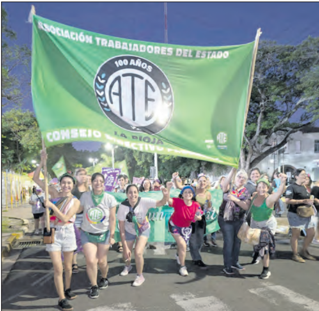
La delegación destacó estos espacios esenciales para pensar en las problemáticas que “nos interpelan hoy”.