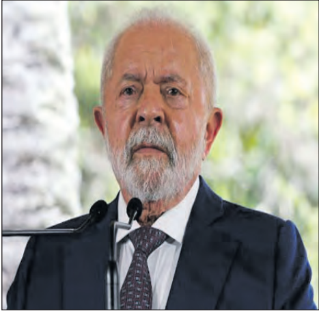
El presidente de Brasil, Luiz Inácio Lula da Silva.

El Gobierno brasileño emitió una alerta consular para advertir sobre los "graves riesgos" que enfrentan ciudadanos que se alistan de forma voluntaria en fuerzas armadas de países en conflicto, tras registrarse un aumento de brasileños muertos o desaparecidos, especialmente en la guerra de Ucrania.