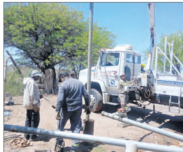
Obreros en plena tarea para garantizar la provisión de agua a los riojanos.

En el departamento Rosario Vera Peñaloza, y anticipándose a los meses de mayor consumo, se concretó la instalación de una electrobomba centrífuga de 40 HP y la automatización del sistema de bombeo en Los Pozos San Carlos, una obra fundamental para optimizar el envío de agua hacia la Planta Potabilizadora de Chepes. Esta intervención permitirá mejorar la presión y la