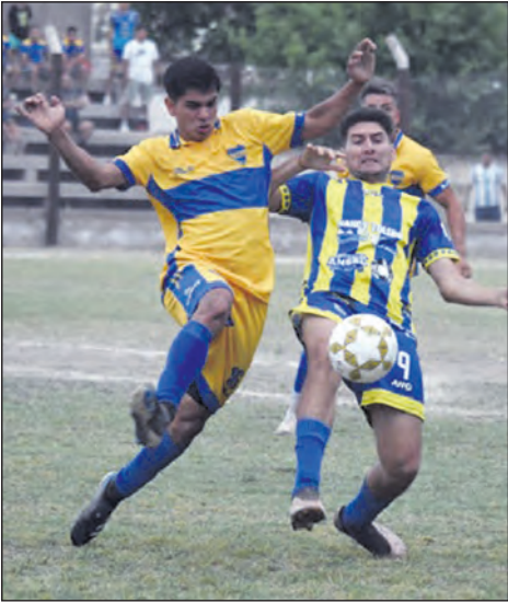
A todo o nada será la revancha esta noche.