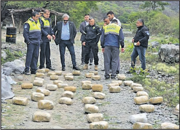
La Policía logró incautar 300 kilos de marihuana en la localidad de Chuscha, Tucumán.

Tras una persecución y un enfrentamiento armado, la Policía logró detener a cuatro adultos y una menor que transportaban más de 300 kilos de marihuana. Fue en la localidad de Chuscha, provincia de Tucumán.