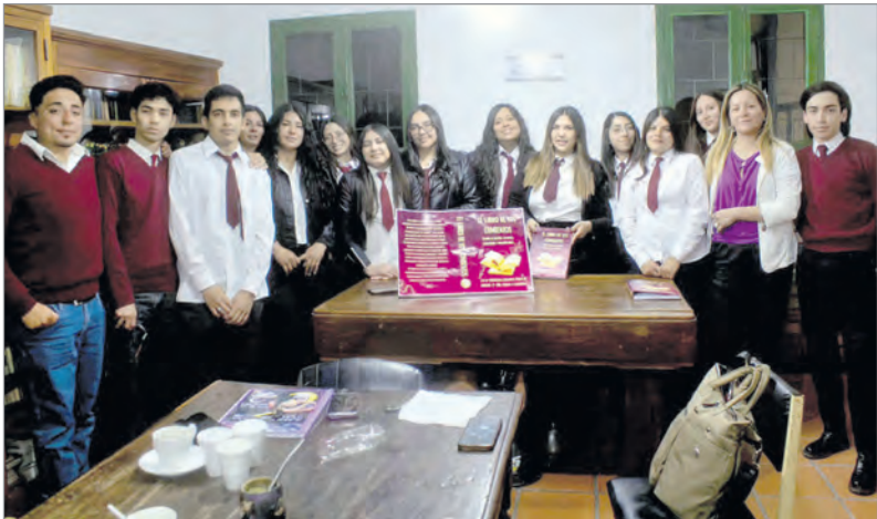
Alumnos en la biblioteca al momento de la presentación del libro.

independiente. Además resaltó que “este acompañamiento y rápida respuesta, refleja el compromiso permanente del Municipio de seguir fortaleciendo el desarrollo productivo de nuestro departamento, brindando herramientas que mejoren las condiciones de trabajo y la calidad de nuestros cultivos”