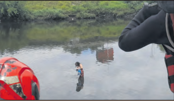
Bomberos junto con la Policía Federal llevaron a cabo el operativo para rescatar a la mujer.

Una mujer que había caído a las aguas del Riachuelo, a la altura de la avenida General Paz, en el límite de Villa Lugano, fue rescatada en la tarde ayer por personal de Bomberos de la Ciudad. Aparentemente, padece problemas psiquiátricos. En tanto, y según informaron las autoridades, la mujer presentaba alteraciones psiquiátricas y fue auxiliada luego de la llamada de algunos vecinos, quienes la habían divisado en el centro del cauce. En consecuencia, el personal de Bomberos, en colaboración con la Policía Federal, ingresó al agua con equipos de neoprene y material de rescate acuático, logrando asegurarla y la llevaron hasta la orilla, donde fue asistida por médicos del SAME. La mujer, finalmente, fue derivada al hospital Santojanni -ubicado en el barrio porteño de Mataderos- con un probable diagnóstico de brote psicótico.