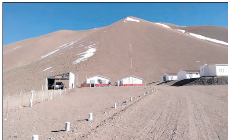
El ingeniero indicó, que el lado chileno debe evaluar cómo está el camino para tener la habilitación

principales del sector es, “hacer el mantenimiento de los caminos, de las rutas principales, caminos primarios, secundarios y terciarios, es casi nuestra obligación. Nuestro insumo principal, que es el combustible, todos los meses está subiendo y eso es prácticamente a veces insostenible” expresó el administrador.