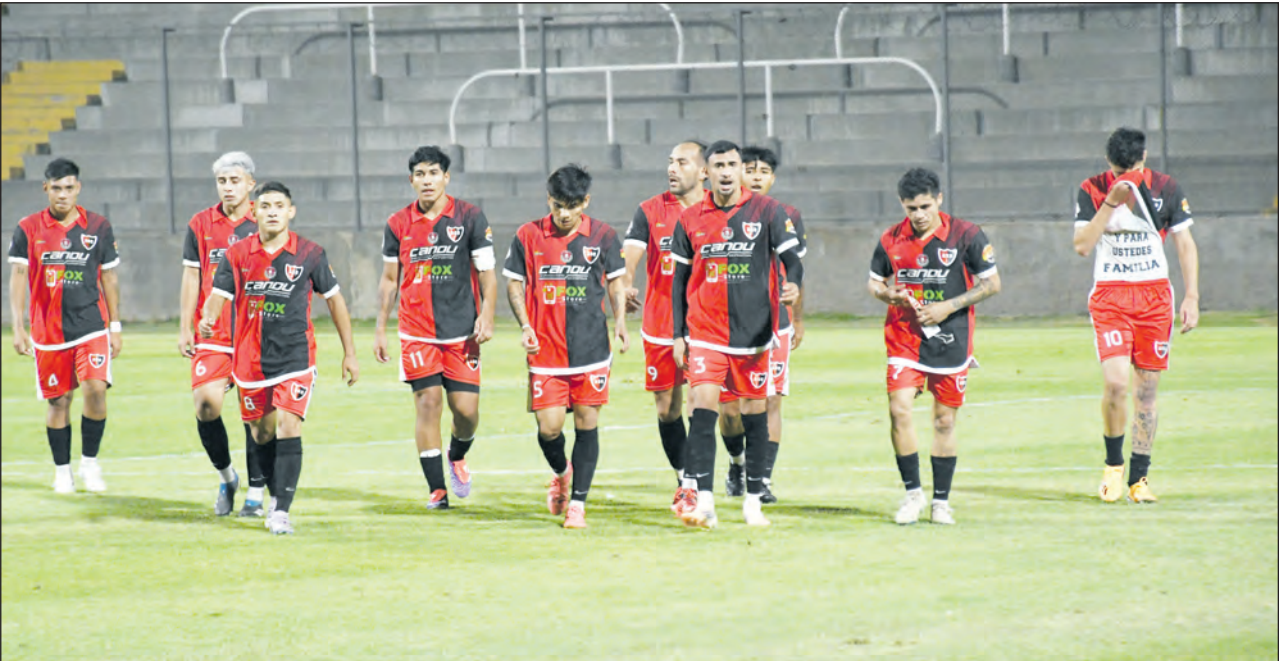
El plantel “rojinegro” deja el campo, los rostros lo dicen todo. El equipo deberá ahora ir buscar la clasificación en la última fecha en Nonogasta.

Un deslucido Andino no pudo otra vez de local, Alto Valle de Olta le ganó en la noche del viernes por 1-0, complicó al “rojinegro” y dejó al rojo vivo la Zona 15 del Regional Amateur. Rafael Andrada marcó el único gol del encuentro.