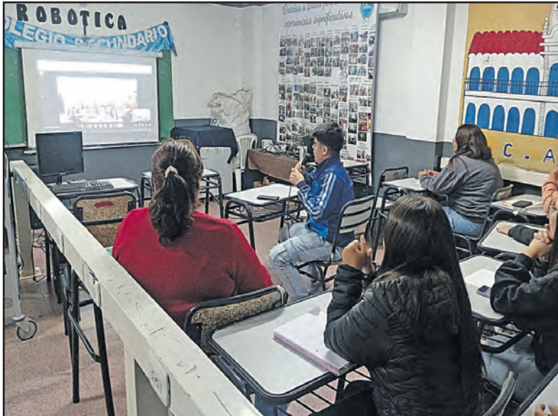
Alumnos del colegio de Vinchina intercambiando conocimientos con los alumnos de Buenos Aires

Esta actividad fue desarrollada por el proyecto institucional "Puertas Abiertas", proyecto de la escuela